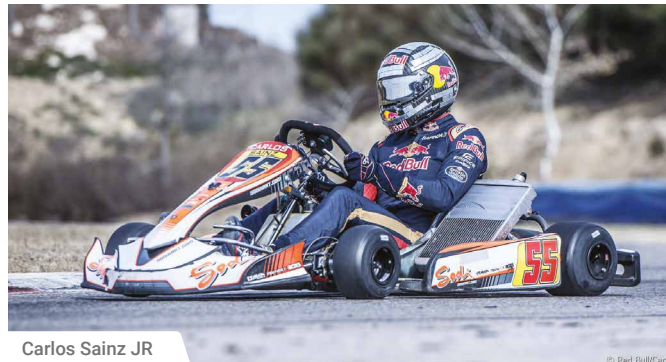
Carlos Sainz JR