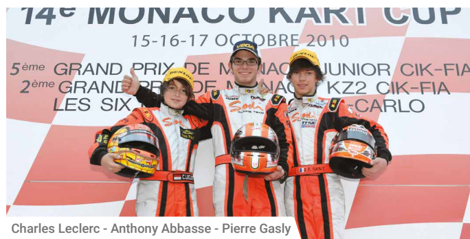
Charles Leclerc - Anthony Abbasse - Pierre Gasly