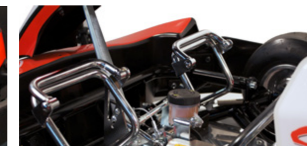
Two foot size pedals Pédales deux positions avec rabat