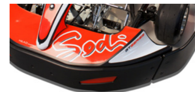
H.E.A.D. System - High Energy Absorption Device H.E.A.D. System - Système d'absorption haute énergie