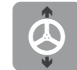
Adjustable steering wheel

Siège réglable (patented system - système breveté)