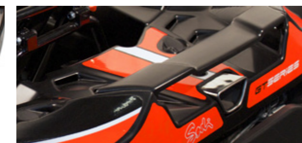
Moderne design Design moderne