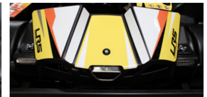
Overlying bodywork for more safety Carrosserie recouvrante pour plus de sécurité